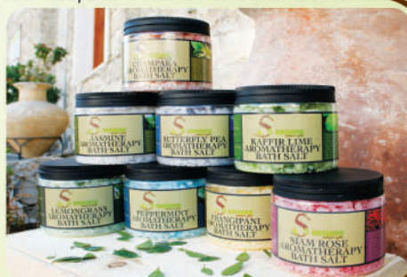
Соль для ванны