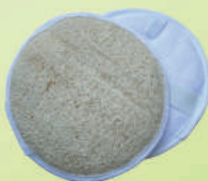
Круглая люфа 15см