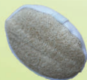
Люфа с губкой