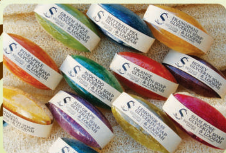
Глицериновое мыло с льной