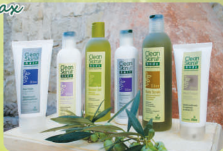
Натуральная косметика для волос и тела