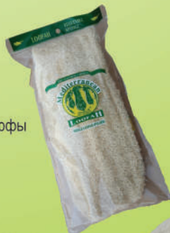
Люфа в упаковке