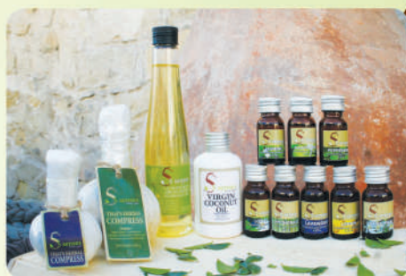
Эфирные масла, компресс и масло для массажа