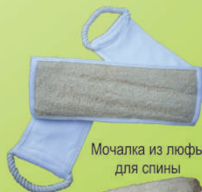
Мочалка из люфы для спины