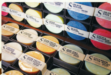
Мыло с эфирными маслами

Широкий выбор натуральной косметики обогащенной эфирными маслами