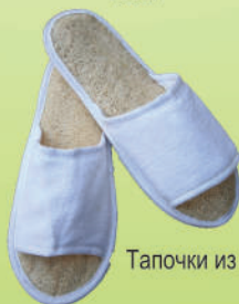
Тапочки из люфы