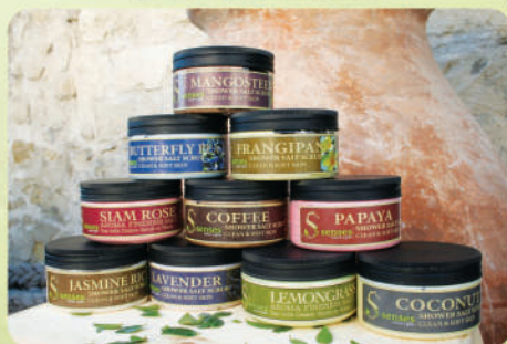
Соль-скраб для тела